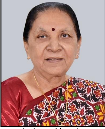
श्रीमती आनंदीबेन पटेल माननीया कुलाधिपति, उत्तर प्रदेश